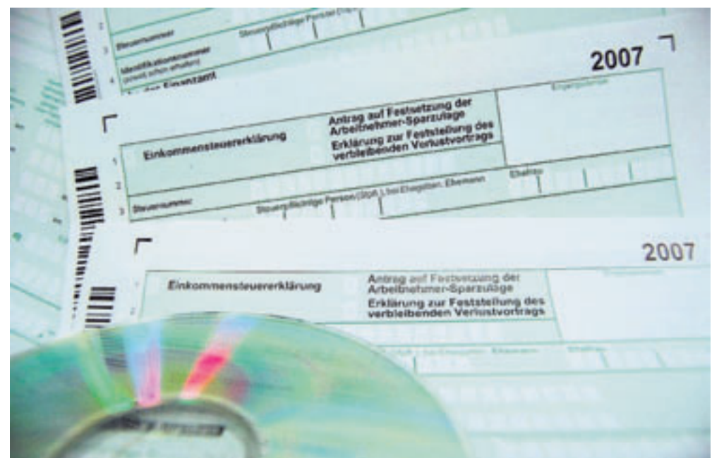
Wer seine Steuererklärung nicht in Papierform abgeben möchte, kann die Daten auch auf elektronischem Wege übermitteln.